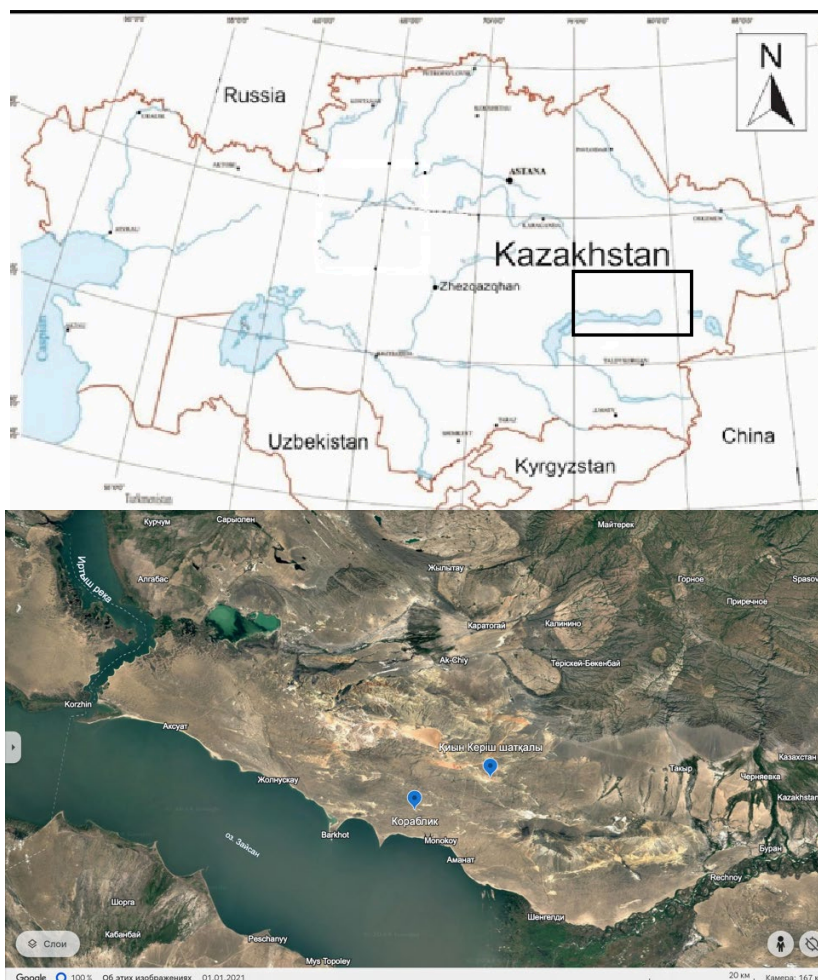
Сурет 1. Қиын-Керіш шатқалындағы «Кораблик» қимасы аймағының зерттеу орнының картасы [21]

«Кораблик» қимасы аймақтың ежелгі климаттық жағдайлары мен экожүйелерін түсінуге мүмкіндік беретін бай өсімдік қалдықтарымен белгілі. Ерте олигоцен дәуіріне жататын бұл қима, өзінің флорасының алуан түрлілігі арқылы, сол кезеңнің экологиялық және климаттық жағдайларын реконструкциялауға айрықша мүмкіндік береді [1, 4].