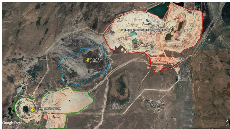
Рисунок 1. Спутниковый снимок местоположения озера Сорколь

дочерним предприятием ТОО «Казцинк». Месторождение окисленных свинцово-цинковых руд, открытое в 1992 году, является уникальным по содержанию цинка (в среднем более 20%), не имеющим аналогов в Казахстане и странах СНГ. Месторождение разрабатывалось открытым способом, на территории исследования находятся карьер и отвалы. Рельеф местности равнинный, абсолютные высоты колеблются от 240 до 247,5 м. Ландшафт, окружающий свалку, сложен озерными впадинами и необычной сетью оврагов и балок [7, с. 9].