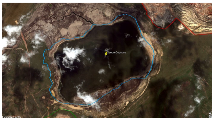
Рисунок 2. Спутниковый снимок района исследования в апреле 2014 года

Сотрудники «Неправительственного экологического фонда имени В.И. Вернадского в Республике Казахстан» опросили местных жителей, которые заявили, что водоем еще существовал в период с 2000 по 2005 год, наполняясь в периоды половодья [9, с. 17]. Спутниковое изображение района исследования за 2014 год наглядно показывает наличие воды в озере, однако размер самого водоема значительно меньше по сравнению с предыдущими периодами (рис. 2).