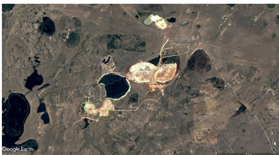
Рисунок 4. Спутниковый снимок района исследования за 2010 год

Таким образом, было собрано 17 изображений места исследования. Затем фотографии были объединены в фильм, что позволило нам увидеть не только динамику исчезновения озера, но и антропогенную модификацию окружающей местности (рис. 4). Кроме того, был сгенерирован индекс NDWI, чтобы математически подтвердить, что водоем высох.