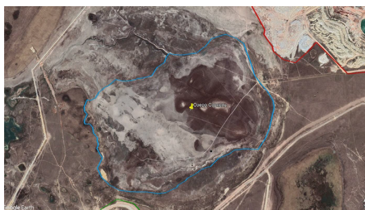
Рисунок 3. Спутниковый снимок района исследования в апреле 2022 года

К 2015 году озеро Сорколь полностью высохло, о чем свидетельствуют последние спутниковые снимки. На следующем спутниковом снимке, сделанном в апреле 2022 года (во время весеннего половодья), озеро как таковое не изображено, и несколько автомобильных дорог пересекают высохшее дно во всех направлениях (рис. 3).