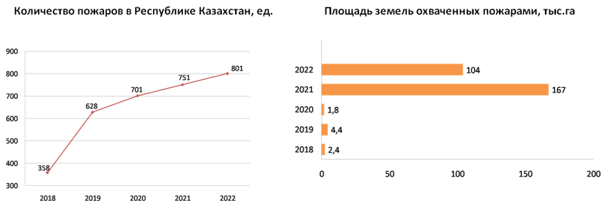
Рисунок 2. Статистика по пожарам лесов по Казахстану [13]

Причинами возникновения лесных пожаров являются природные (неконтролируемые сельскохозяйственные палы) и антропогенные факторы («сухие» грозы). Кроме того, серьезной угрозой лесным ресурсам является периодическое распространение вредителей и болезней леса.