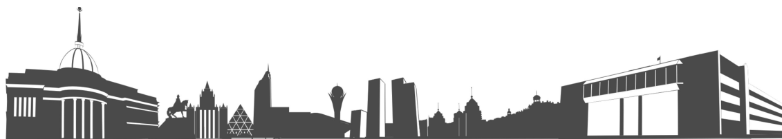
Рисунок 1 – Title of figure

Figures must be saved individually and separate to text. All figures must be numbered in the order in which they appear in the article (e.g. figure 1, figure 2). In multi-part figures, each part should be labeled (e.g. figure 1(a), figure 1(b)). Figures must be of sufficiently high resolution (minimum 600 dpi). It is preferable to prepare figures in black-and-white or grey color scale. Figures should be clear, clean, not scanned (PS, PDF, TIFF, GIF, JPEG, BMP, PCX).